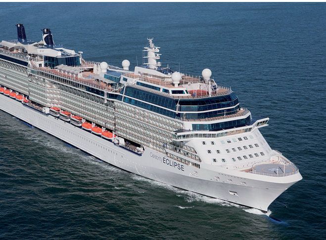
La nave da crociera Celebrity ECLIPSE, costruita dal cantiere navale tedesco Meyer Werft a Papenburg e assicurata con avalli Euler Hermes.